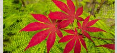
Barevný podzim Vám přeje Jaroslav Žák

místním obchodem. U posledně zmíněného nám příliš nepřeje počasí. Přes deštivý začátek podzimu se nenechme