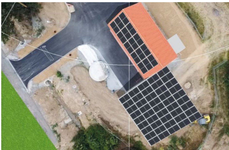
Umístění panelů na objektu a přilehlé ploše